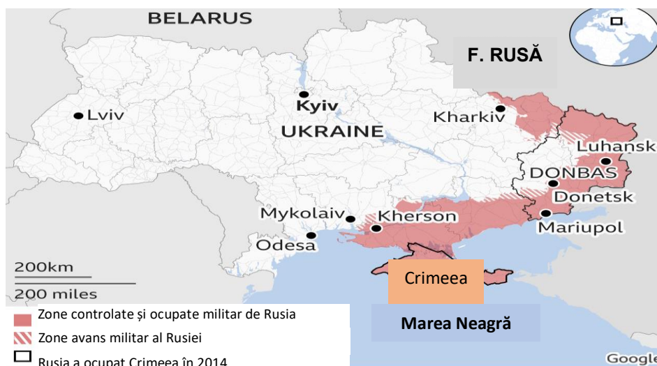
Parti ale teritoriului Ucrainei aflate sub ocupația și controlul militar al Rusiei

La începutul anului 2021, Ucraina deținea 400 de milioane de barili de rezerve dovedite de petrol, statul ucrainian bazându-se în mare măsură pe importuri de petrol pentru a-și satisface cererea. Ucraina importa majoritatea produselor petroliere din Belarus, Rusia și Germania și importurile de țiței erau provenite din ce în ce mai mult din Azerbaijan și Kazahstan, pentru rafinăria operațională a Ucrainei, instalația Kremenchug. În același context, nu trebuie să ometem câteva lucruri foarte importante: Ucraina a constituit o țară de tranzit pentru exporturile de țiței ale Rusiei, care sunt destinate pentru Slovacia, Ungaria și Cehia prin ramura de sud a rețelei de conducte Druzhba, care transportă 400.000 barili/zi.